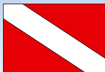
Flaget benyttes i enkelte store lande som USA og Australien, men er ikke lovlig afmærkning i danske farvande.